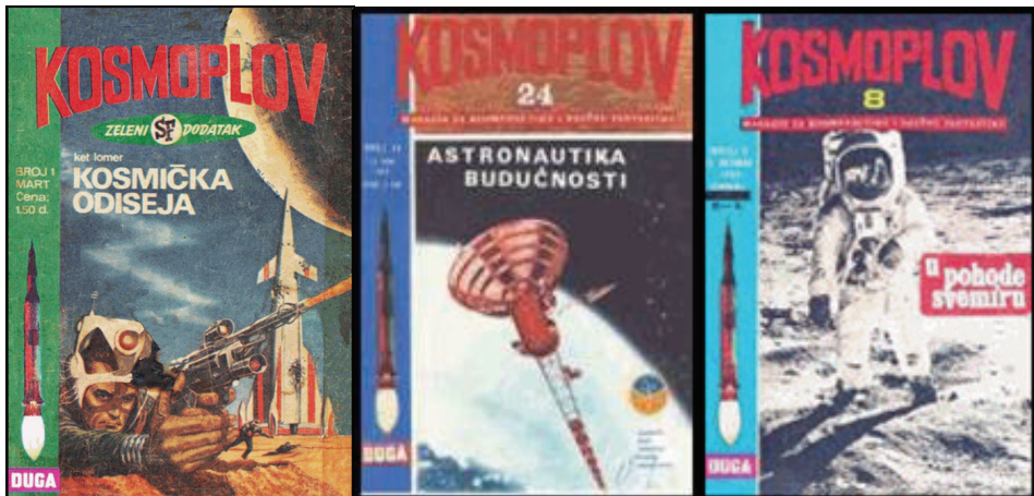
Слика 1. Часопис „Космоплов“.