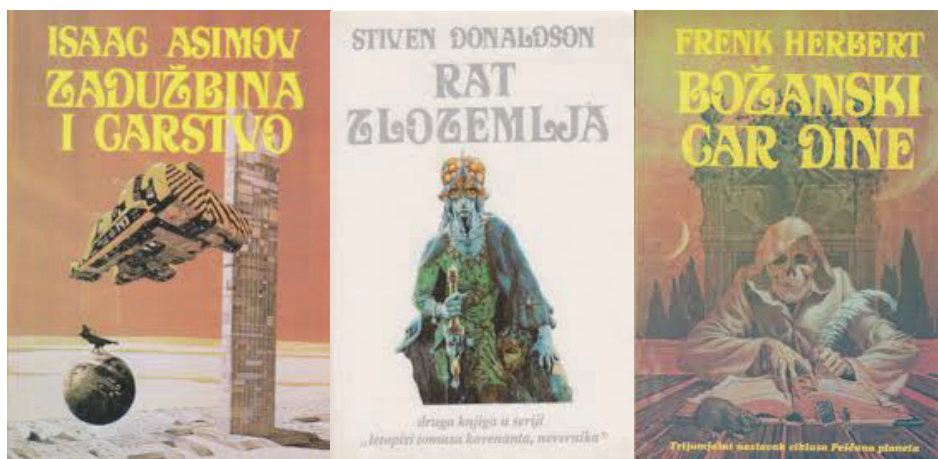
Слика 6. Едиција „Поларис“.