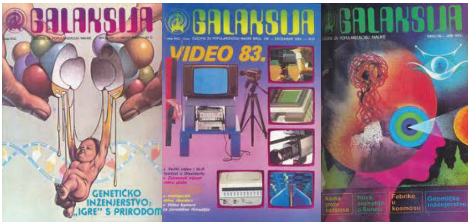
Слика 2. Часопис „Галаксија“.