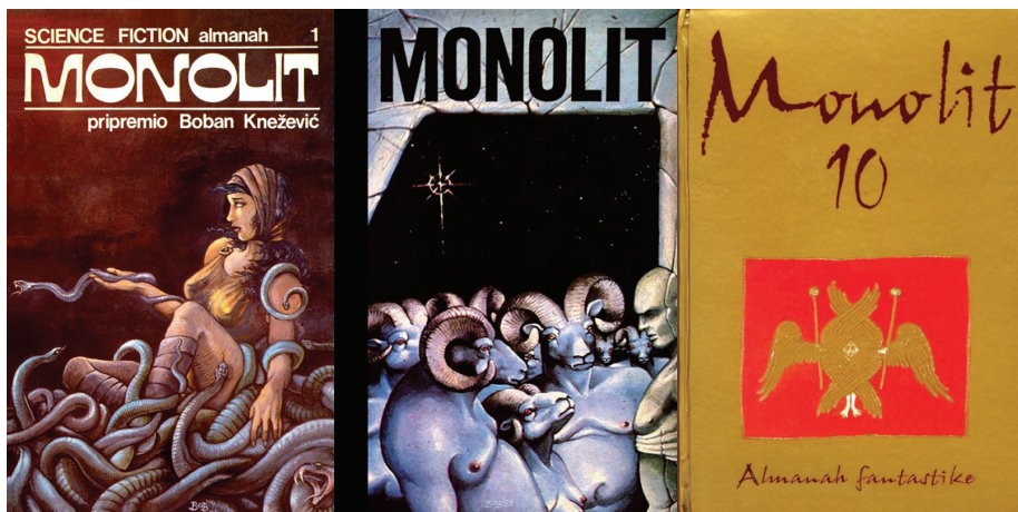
Слика 7. Алманах „Монолит“.