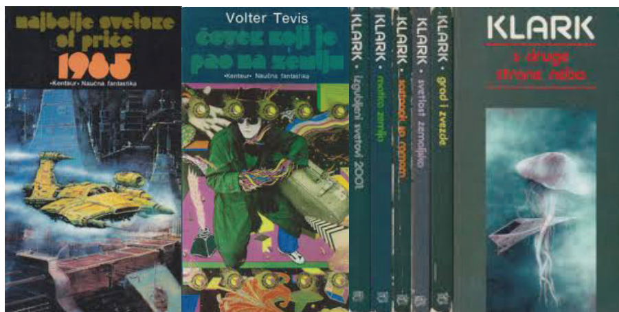
Слика 4. Едиција „Кентаур“.

Едиција “Kentaур” је покренута 1967. године и објављено је неколико књига. Свој нови почетак та едиција је имала 1976. године. Уз пробране наслове и изузетан квалитет за тадашње услове била је прави светионик научне фантастике у Југославији. Дела најпознатијих писаца су била објављена у тој едицији (Артур Кларк, Исак Асимов, Станислав Лем, Урсула ЛеГуин, Филип Дик, Френк Херберт итд.) и имала су сасвим солидан тираж. Едиција је покрила доста поджанрова научне фантастике – од утопије и антиутопије до тзв. “тврде” научне фантастике. Објављивала је и дела која су пратила дух времена – дела која су спадала у тзв. “нови талас” који је постао доминантан у научној фантастици у другој половини ’60-их и првој половини ’70-их година. Сваки љубитељ sf-а могао је у овој едицији да пронађе нешто за себе. Едиција је “потрајала” читаву деценију и поставила је неке одређене стандард квалитета објављених дела овог жанра на територији СФРЈ.